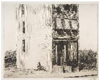
Edward Hopper La casa solitaria , 1923 (The Lonely House) Grabado. 19,9 x 25 cm The Metropolitan Museum of Art, Nueva York. Harris Brisbane Dick Fund