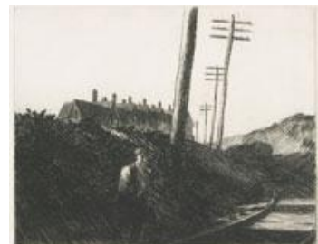
Edward Hopper El ferrocarril , 1922 (The Railroad) Grabado. 19,9 x 24,9 cm The Metropolitan Museum of Art, Nueva York. Harris Brisbane Dick Fund