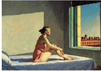
Edward Hopper Sol de la mañana , 1952 (Morning Sun) Óleo sobre lienzo. 71,4 x 101,9 cm Columbus Museum of Art, Ohio: Howald Fund Purchase