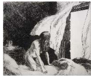
Edward Hopper Viento del anochecer , 1920 (Evening Wind) Grabado. 33,34 x 39,37 cm National Gallery of Art, Washington, Rosenwald Collection, 1943