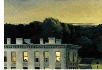
Edward Hopper Casa al anochecer , 1935 (House at Dusk) Óleo sobre lienzo. 92,1 x 127 cm Virginia Museum of Fine Arts, Richmond, The John Barton Payne Fund