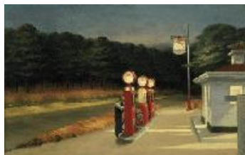
Edward Hopper Gasolina , 1940 (Gas) Óleo sobre lienzo. 66,7 x 102,2 cm The Museum of Modern Art, Nueva