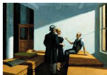
Edward Hopper Reunión nocturna , 1949 (Conference at Night) Óleo sobre lienzo. 71,7 x 102,4 cm Wichita Art Museum, Roland P. Murdock Collection