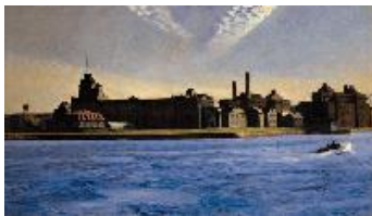
Edward Hopper Blackwell's Island , 1928 (Blackwell's Island) Óleo sobre lienzo. 88,9 x 152,4 cm Colección Soledad and Robert Hurst