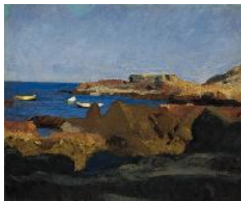
Edward Hopper Cala en Ogunquit , 1914 (Cove at Ogunquit) Óleo sobre lienzo. 61,8 x 74,5 cm Whitney Museum of American Art, New York. Josephine N. Hopper Bequest