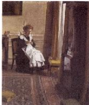
Félix Vallotton Asistenta cosiendo en un interior , 1906 (Femme de chambre cousant dans un intérieur) Óleo sobre lienzo. 50 x 61 cm Colección privada