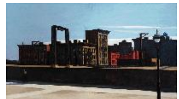
Edward Hopper El Loop del Puente de Manhattan , 1928 (Manhattan Bridge Loop) Óleo sobre lienzo. 88,9 x 152,4 cm Addison Gallery of American Art, Phillips Academy, Andover, Massachusetts; Donación de Stephen Clark