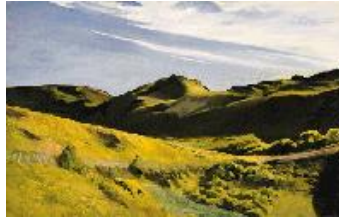
Edward Hopper The Camel's Hump , 1931 (The Camel's Hump) Óleo sobre lienzo. 81,9 x 127,3 cm Munson-William-Proctor Art Institute, Museum of Art, Utica, New York