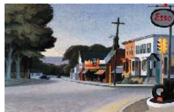
Edward Hopper Retrato de Orleans , 1950 (Portrait of Orleans) Óleo sobre lienzo. 66 x 101,6 cm Fine Arts Museums of San Francisco, Gift of Jerrold and June Kingsley