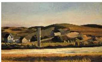
Edward Hopper (Carretera y casas, South Truro) , 1930-1933 ((Road and Houses, South Truro)) Óleo sobre lienzo. 68,58 x 109,22 cm Whitney Museum of American Art, New York. Josephine N. Hopper Bequest