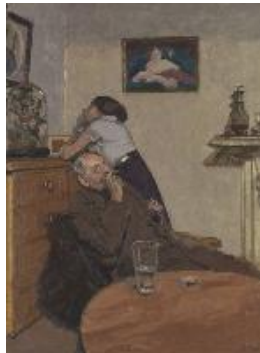
Walter Sickert Ennui (Aburrimiento) , c. 1914 (Ennui) Óleo sobre lienzo. 152,4 x 112,4 cm TATE: Presented by the Contemporary Art Society 1924, Londres