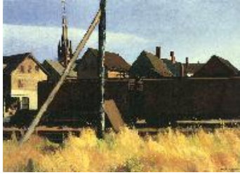
Edward Hopper Vagones de mercancías, Gloucester , 1928 (Freight Cars, Gloucester) Óleo sobre lienzo. 74 x 102,2 cm Addison Gallery of American Art, Phillips Academy, Andover, Massachusetts; gift of Edward Wales Root in recognition of the 25th Anniversary of the Addison Gallery