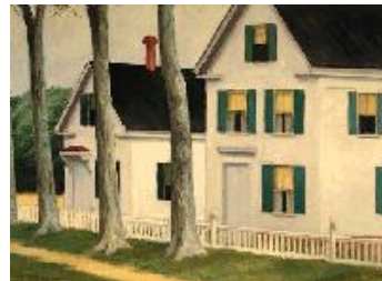
Edward Hopper Dos puritanos , 1945 (Two Puritans) Óleo sobre lienzo. 76,2 x 101,6 cm Colección privada; Courtesy of Ronald Feldman Fine Arts, New York