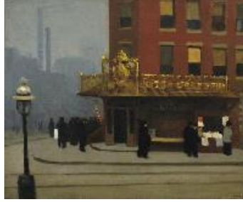
Edward Hopper Esquina de Nueva York ( Corner Saloon ), 1913 (New York Corner (Corner Saloon)) Óleo sobre lienzo. 61 x 73,7 cm Colección privada.