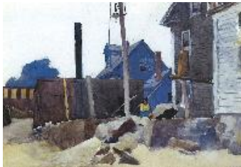
Edward Hopper Casa en la orilla , 1924 (House on the Shore) Acuarela sobre papel. 35,6 x 50,8 cm Colección privada.