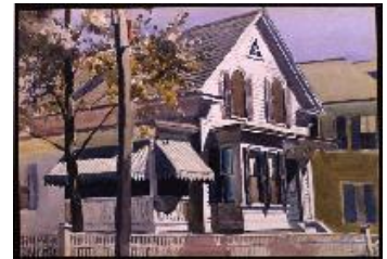
Edward Hopper La casa de Marty Welch , 1928 (Marty Welch's House) Acuarela sobre papel. 35,6 x 50,8 cm Colección privada.