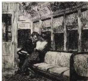
Edward Hopper Noche en el Tren Elevado , 1918 (Night on the El Train) Grabado. 18,7 x 19,9 cm The Metropolitan Museum of Art, Harris Brisbane Dick Fund, New York