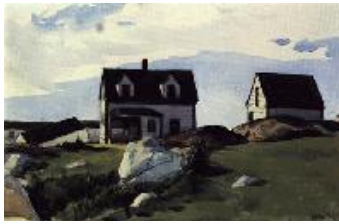
Edward Hopper Casas en Squam Light, Gloucester , 1923 (Houses of Squam Light, Gloucester) Acuarela sobre papel. 28,6 x 44,3 cm Museum of Fine Arts (Bequest of John T. Spaulding), Boston