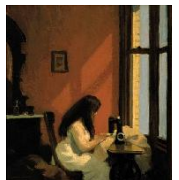
Edward Hopper Muchacha cosiendo a máquina , 1921- 22 (Girl at a Sewing Machine)