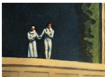
Edward Hopper Dos cómicos , 1966 (Two Comedians) Óleo sobre lienzo. 78,1 x 106 cm Colección privada