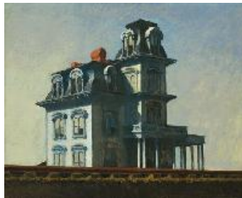
Edward Hopper Casa junto a la vía del tren , 1925 (House by the Railroad) Óleo sobre lienzo. 61 x 73,7 cm The Museum of Modern Art, New York. Donación de Stephen Clark, 1930