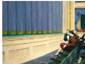
Edward Hopper Primera fila , 1951 (First Row Orchestra) Óleo sobre lienzo. 79 x 101,9 cm Hirshhorn Museum and Sculpture Garden, Smithsonian Institute, Washington D.C.; Gift of the Joseph H. Hirshhorn Foundation, 1966