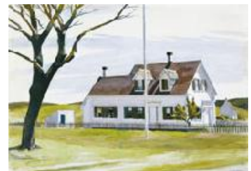
Edward Hopper Arbol seco y vista lateral de la Casa Lombard , 1931 (Dead Tree and Side of Lombard House) Acuarela sobre papel. 50,8 x 71,2 cm Museo Thyssen-Bornemisza, Madrid