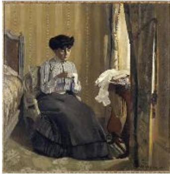
Félix Vallotton Mujer cosiendo en un interior , 1905 (Femme cousant dans un intérieur) Óleo sobre lienzo. 67 x 66 cm Ville de Troyes Musée d'Art moderne, Collections nationales Pierre et Denise Lèvy

Óleo sobre lienzo. 48,3 x 46 cm Museo Thyssen-Bornemisza, Madrid