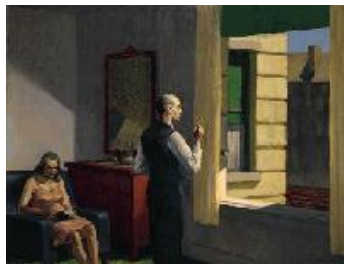
Edward Hopper Hotel junto al ferrocarril , 1952 (Hotel by a Railroad) Óleo sobre lienzo. 79,4 x 101,9 cm Hirshhorn Museum and Sculpture Garden, Smithsonian Institute, Washington, D.C.; Gift of the Joseph H. Hirshhorn Foundation, 1966