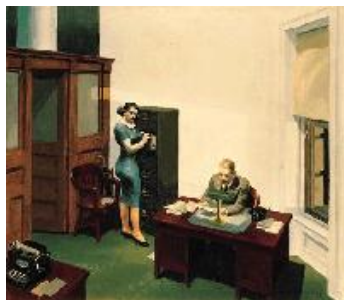
Edward Hopper Oficina de noche , 1940 (Office at Night) Óleo sobre lienzo. 56,3 x 63,8 cm Collection Walker Art Center, Minneapolis; Gift of the T. B. Walker Foundation, Gilbert M. Walker Fund, 1948