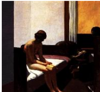
Edward Hopper Habitación de hotel , 1931 (Hotel Room) Óleo sobre lienzo. 152,4 x 165,7 cm Museo Thyssen-Bornemisza, Madrid