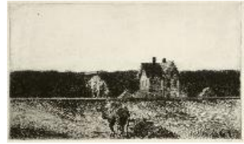
Edward Hopper Paisaje americano , 1920 Grabado. 32,6 x 44,2 cm National Gallery of Art, Washington, Rosenwald Collection, 1949

National Gallery of Art, Washington. Rosenwald Collection 1949