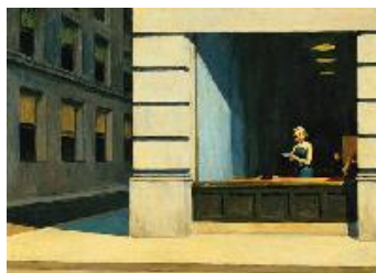
Edward Hopper Oficina en Nueva York , 1962 (New York Office) Óleo sobre lienzo. 102,9 x 140 cm Montgomery Museum of Fine Arts, Montgomery, Alabama, The Blount Collection