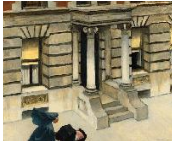
Edward Hopper Pavimentos de Nueva York , 1924 ó 1925 (New York Pavements) Óleo sobre lienzo. 62,9 x 75,6 cm Chrysler Museum of Art, Norfolk, VA; Gift of Walter P. Chrysler, Jr.