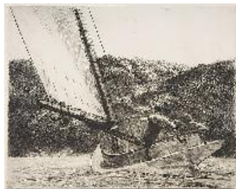
Edward Hopper El Cat Boat , 1922 (The Cat Boat) Grabado. 35,56 x 37,78 cm

National Gallery of Art, Washington. Rosenwald Collection 1949