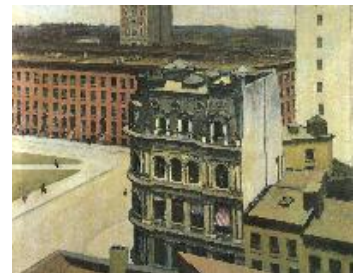
Edward Hopper La ciudad , 1927 (The City) Óleo sobre lienzo. 71,1 x 91,4 cm The University of Arizona Museum of Art, Gift of C. Leonard Pfeiffer