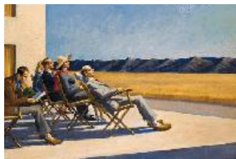
Edward Hopper Gente al sol , 1960 (People in the Sun) Óleo sobre lienzo. 102,6 x 153,4 cm Smithsonian American Art Museum, Washington D.C.; Gift of S.C. Johnson & Son, Inc.