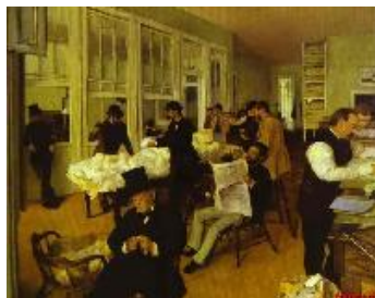
Edgar Degas Una lonja de algodón en Nueva Orleans , 1873 (Un bureau de coton à La Nouvelle-Orléans) Óleo sobre lienzo. 73 x 92 cm Musée des Beaux-Arts, Pau