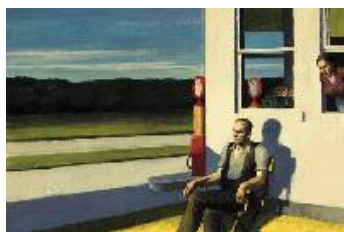
Edward Hopper Carretera de cuatro carriles , 1956 (Four Lane Road) Óleo sobre lienzo. 69,9 x 105,4 cm Colección privada