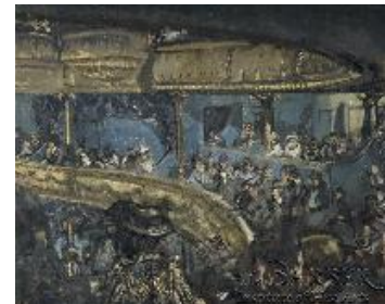
Walter Sickert El Eldorado, París , c. 1906 (The Eldorado, Paris) Óleo sobre lienzo. 50,2 x 61,2 cm The Trustees of the Barber Institute of Fine Arts, University of Birmingham