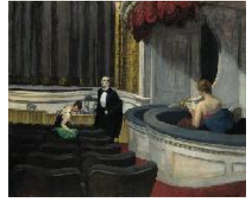
Edward Hopper Dos en el patio de butacas , 1927 (Two on the Aisle) Óleo sobre lienzo. 102 x 122,5 cm The Toledo Museum of Art, Toledo, Ohio; Purchased with funds from the Libbey Endowment, Gift of Edward Drummond Libbey