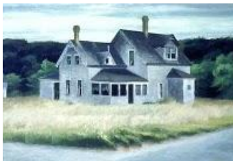
Edward Hopper Casa junto a una carretera , c.1942 Óleo sobre lienzo. 48,26 x 68,58 cm ASU Art Museum (Gift of Oliver B. James), Tempe