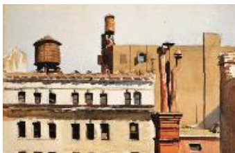
Edward Hopper Azoteas , 1926 (Rooftops) Acuarela y lápiz sobre papel. 32,7 x 50,5 cm Whitney Museum of American Art, New York. Josephine N. Hopper Bequest