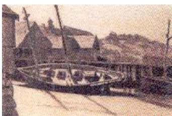
Edward Hopper Barcos en el embarcadero de Gloucester , 1923 (Gloucester Boats at Wharf)