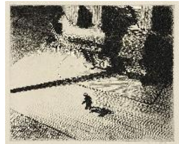
Edward Hopper Sombras nocturnas , 1921 (Night Shadows) Grabado. 17,4 x 20,8 cm The Metropolitan Museum of Art, Harris Brisbane Dick Fund, Nueva York