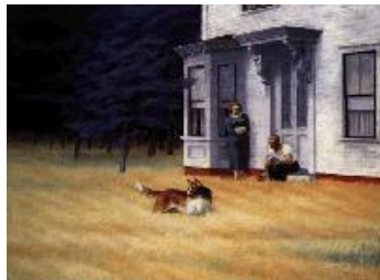
Edward Hopper Anochecer en Cape Cod , 1939 (Cape Cod Evening) Óleo sobre lienzo. 76,2 x 101,6 cm National Gallery of Art, Washington D.C. John Hay Whitney Collection