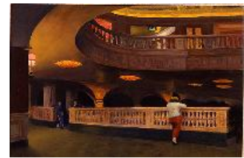
Edward Hopper El Teatro Sheridan , 1937 (The Sheridan Theatre) Óleo sobre lienzo. 43,2 x 63,5 cm The Newark Museum. Purchase 1940 Felix Fuld Bequest Fund