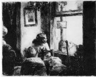
Edward Hopper Interior en el East Side , 1922. Grabado. 19,7 x 24,9 cm Terra Foundation of American Art, Chicago, Daniel J. Terra Collection