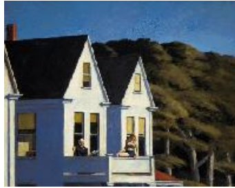
Edward Hopper Sol en el segundo piso , 1960 (Second Story Sunlight) Óleo sobre lienzo. 101,9 x 127,5 cm Whitney Museum of American Art, Nueva York. Purchase, with funds from the Friends of the Whitney Museum of American Art