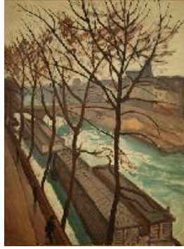
Albert Marquet El muelle Bourbon , 1908 (Le quai Bourbon) Óleo sobre lienzo. 92 x 73 cm Musée des Beaux-Arts de Bordeaux, Burdeos