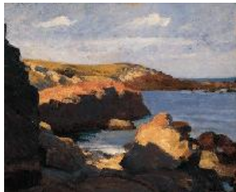
Edward Hopper Mar en Ogunquit , 1914 (Sea at Ogunquit) Óleo sobre lienzo. 61,4 x 74 cm Whitney Museum of American Art, New York. Josephine N. Hopper Bequest