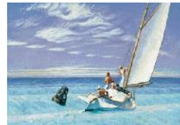
Edward Hopper Brisa de tierra , 1939 (Ground Swell) Óleo sobre lienzo. 91,9 x 127,2 cm Corcoran Gallery of Art, Washington, DC, Museum purchase, William A. Clark Fund