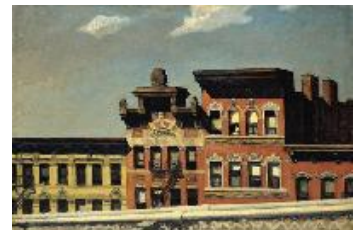
Edward Hopper Desde el puente de Williamsburg , 1928 (From Williamsburg Bridge) Óleo sobre lienzo. 73,7 x 109,2 cm The Metropolitan Museum of Art, Nueva York; George A. Hearn Fund, 1937