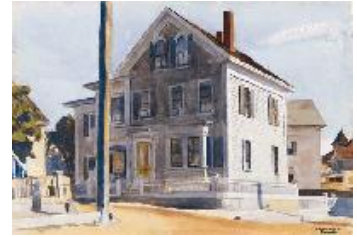
Edward Hopper La casa de los Abbot , 1926 (Abbot's House) Acuarela sobre papel. 34,3 x 49,5 cm New Britain Museum of American Art, Harriet Russell Stanley Fund