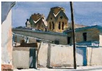
Edward Hopper Torres de St. Francis, Santa Fé , 1925 (St. Francis' Towers, Santa Fé) Acuarela sobre papel. 34,3 x 49,5 cm The Phillips Collection (Acquired 1926), Washington D.C.