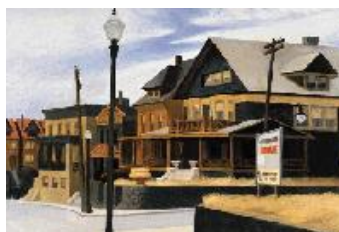
Edward Hopper Viento del este en Weehawken , 1934 (East Wind over Weehawken) Óleo sobre lienzo. 86,4 x 127,6 cm Pennsylvania Academy of the Fine Arts (John Lambert Fund), Filadelfia