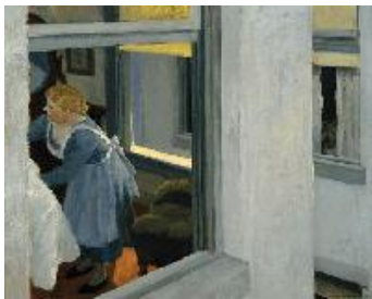
Edward Hopper Apartamentos , 1923 (Apartment Houses) Óleo sobre lienzo. 61 x 73,5 cm Pennsylvania Academy of the Fine Arts (John Lambert Fund), Philadelphia