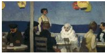
Edward Hopper Soir Bleu , 1914 (Soir Bleu) Óleo sobre lienzo. 91,4 x 182,9 cm Whitney Museum of American Art, New York. Josephine N. Hopper Bequest