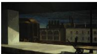
Edward Hopper Amanecer en Pensilvania , 1942 (Dawn in Pennsylvania) Óleo sobre lienzo. 61,9 x 112,4 cm Terra Foundation for American Art, Chicago, Daniel J. Terra Collection