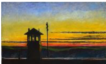
Edward Hopper Puesta de sol ferroviaria , 1929 (Railroad Sunset) Óleo sobre lienzo. 74,3 x 121,92 cm Whitney Museum of American Art, New York. Josephine N. Hopper Bequest