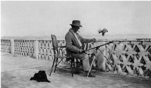
Raoul Dufy pintando del natural en El Havre, hacia 1925

En 1929, la galería Dudensig le dedica la primera exposición monográfica en Nueva York. Un año más tarde comienza a trabajar para la casa de productos textiles Onondaga de Nueva York, mientras realiza varios trabajos cerámicos, textiles y pinturas por encargo, como los retratos de la familia de Auguste