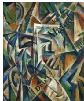
Nadeshda UDALTSOVA Cubismo , 1914 (Cubism) Óleo sobre lienzo. 72 x 60 cm (con marco 105.5 x 93 cm) Museo Nacional Thyssen-Bornemisza, Madrid