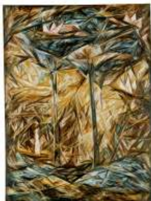
Natalia GONCHAROVA El bosque , 1913 (The Forest) Óleo sobre lienzo. 130 x 97 cm (con marco 139.5 x 105 cm) Museo Nacional Thyssen-Bornemisza, Madrid