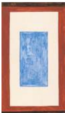
Natalia GONCHAROVA Composición con rectángulo azul , c. 1950-1959 (Composition with Blue Rectangle) Gouache sobre papel. 47,7 x 26,7 cm (con marco 61.5 x 40 cm) Museo Nacional Thyssen-Bornemisza, Madrid