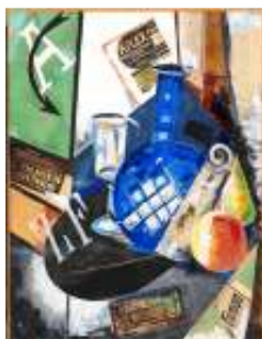
Alexandra EXTER Naturaleza muerta , 1913 (Still Life) Collage y óleo sobre lienzo. 68 x 53 cm (con marco 97 x 82 cm) Museo Nacional Thyssen-Bornemisza, Madrid