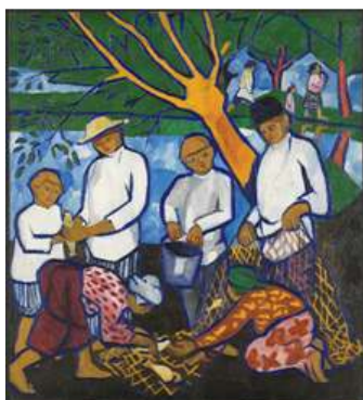
Natalia GONCHAROVA Pesca (Pescadores) , 1909 (Fishing (fishers)) Óleo sobre lienzo. 112 x 99,7 cm (con marco 145.5 x 131 cm) Colección Carmen Thyssen-Bornemisza en depósito en el Museo Nacional Thyssen-Bornemisza

SALA 43. PLANTA BAJA / ROOM 43. GROUND FLOOR