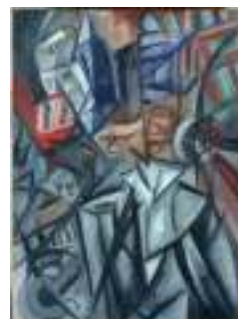
Olga RÓZANOVA Hombre en la calle (Análisis de volúmenes) , 1913 (Man on the Street (Analysis of Volumes)) Óleo sobre lienzo. 83 x 61,5 cm (con marco 103 x 80.5 cm) Museo Nacional Thyssen-Bornemisza, Madrid